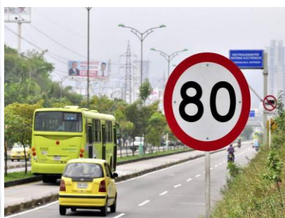
VANGUARDIA/ABRIL 1 DE 2014