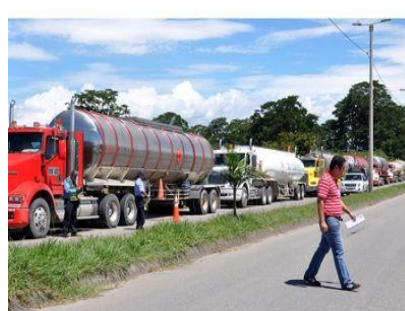
LA NACIÓN/ABRIL 1 DE 2014

POR UNA RENOVACIÓN INSTITUCIONAL DEL TRANSPORTE ADITT 25 AÑOS