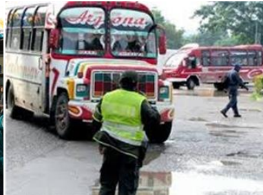
ENERO 22 DE 2014