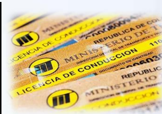
ENERO 14 DE 2014