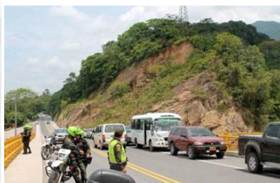
VANGUARDIA/MARZO 14 DE 2014