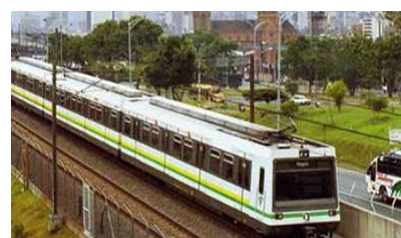
EL NUEVO SIGLO/ MARZO 14 DE 2014