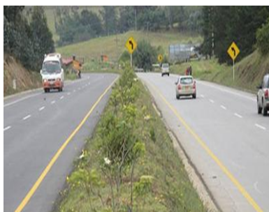
NUEVO SIGLO/MARZO 17 DE 2014