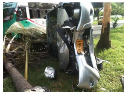
LA REPUBLICA/ MARZO 17 DE 2014