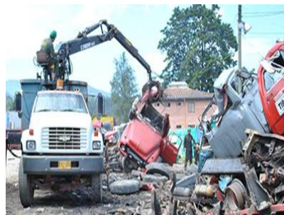
EL NUEVO SIGLO/ MARZO 18 DE 2014