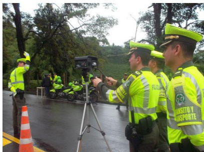
LA CRONICA DEL QUINDIO / MARZO 18 DE 2014