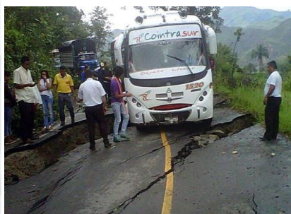
EL NUEVO DIA/MARZO 17 DE 2014