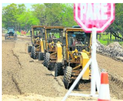
PORTAFOLIO / MARZO 19 DE 2014