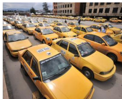
PORTAFOLIO/MARZO 19 DE 2014