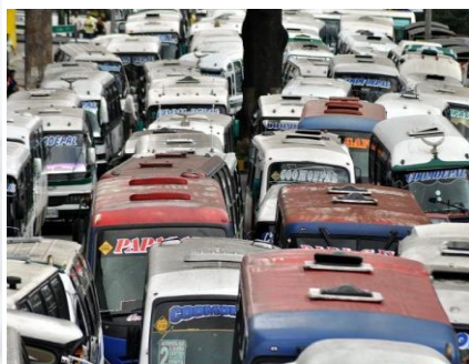
EL NUEVO SIGLO/MARZO 19 DE 2014