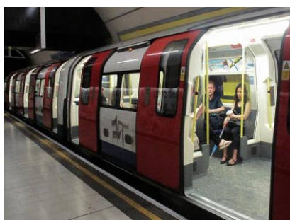
LA REPUBLICA/MARZO 31 DE 2014