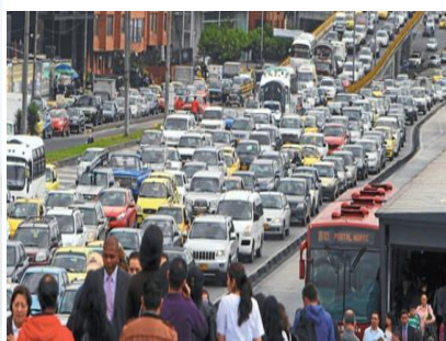
EL TIEMPO/MARZO 29 DE 2014